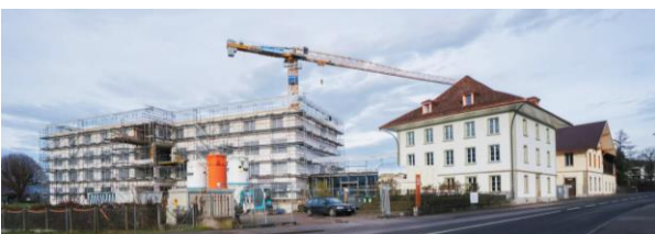
Neuer Bettentrakt und Herrenstock im Überblick

Mitte April 2021 soll das Musterzimmer im Dachgeschoss, dem zukünftigen Betreuten Wohnen «Spitalmatte», fertiggestellt werden. Um der Bevölkerung sowie Interessentinnen und Interessenten einen Blick in den Neubau zu gewähren, wird, wenn es die Situation erlaubt, am 24. April 2021 ein Tag der offenen Baustelle organisiert. Weitere Informationen zur Veranstaltung verkünden wir zu gegebener Zeit.