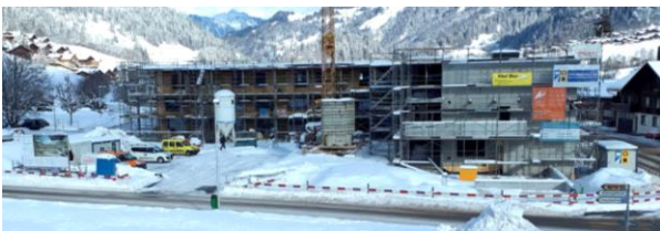
Tiefster Winter auf der Baustelle Spitalmatte

In Zweisimmen konnten die Fenster noch vor dem neuen Jahr eingesetzt werden, so dass der Bau nun vor Wind, Regen und Schnee geschützt ist. Seit der Wiederaufnahme der Innenausbauarbeiten wurde in den Nasszellen der Unterboden eingegossen, die Arbeiten an der Lüftungs-, Heizungs- und Sanitäranlage begonnen sowie die gesamte Holzfassade angebracht.