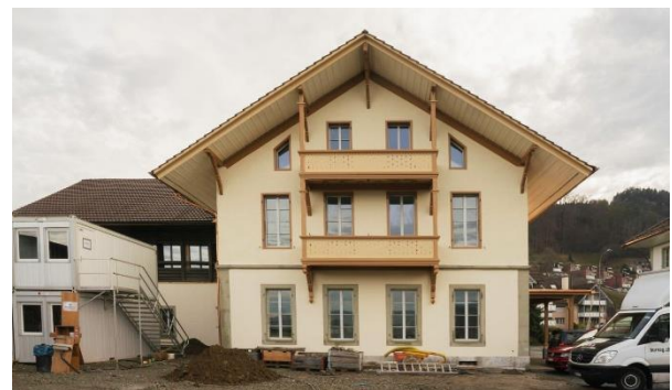
Das künftige Betreute Wohnen «Von Jud-Haus»

Wie zuvor soll der Garten ein Zuhause für die Heimtiere sowie ein Ruhepol für Bewohnende und Besuchende sein. Die Gartenplanung schreitet rasch voran, um dieses Ziel zu erreichen.